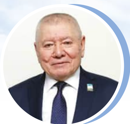
Бадриддин НАСРИЕВ, ЎЗХДП Самарқанд вилоят кенгаши раиси, халқ депутатлари вилоят Кенгаши депутати.